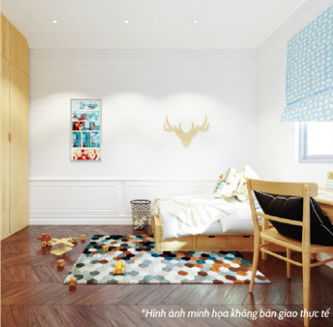
*Hình ảnh minh họa không bán giao thực tế