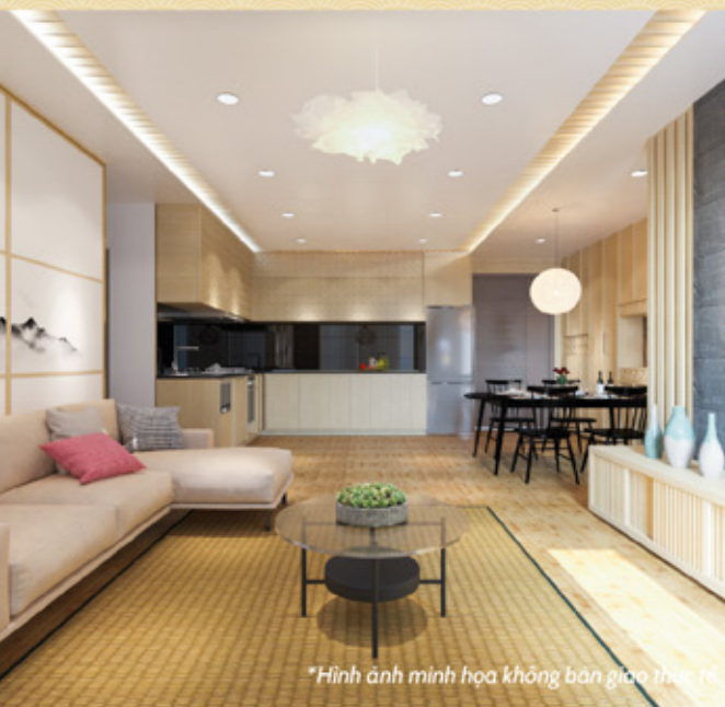
*Hình ảnh minh họa không bán giao thực tế